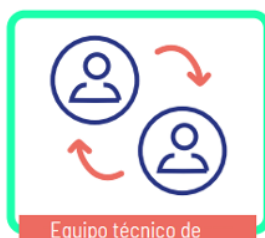
Equipo técnico de selección ciudadana

Asesoramiento y orientación en todos los aspectos de diseño y funcionamiento de la Asamblea con el fin generar un debate de la ciudadanía amplio e informado