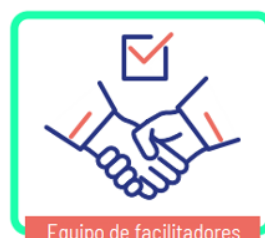
Equipo de facilitadores

Equipo independiente que garantizará una selección de participantes hecha al azar y que represente de forma equilibrada la diversidad de la población española