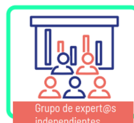
Grupo de expert@s independientes

Facilita los trabajos técnicos de preparación, puesta en marcha y apoyo logístico